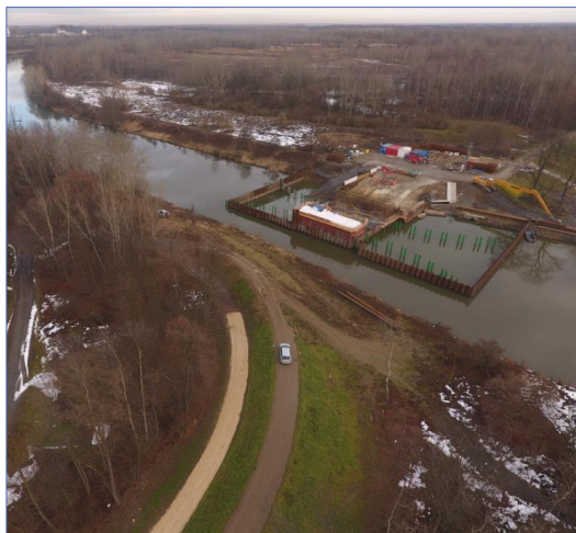
IV KWARTAŁ 2022