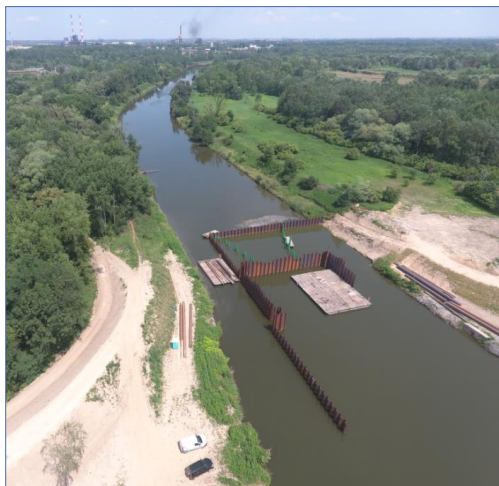
II KWARTAŁ 2022

Widok na budowę wrót przeciwpowodziowych w różnych fazach realizacji: